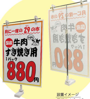
設置イメージ 用紙サイズ: A3