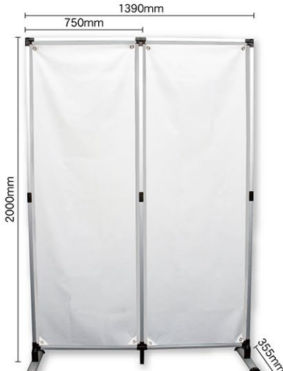
本体1台+連結パーツキット品1台 メディアサイズW600×H1800mmの場合