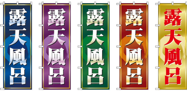
高級感・深みがある