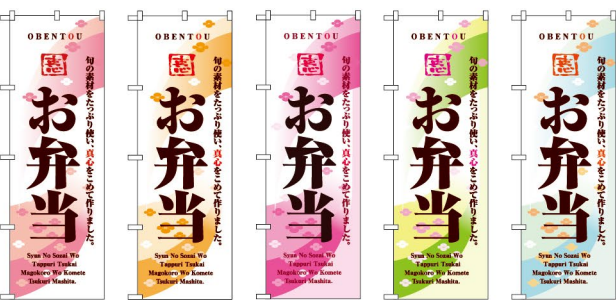
可愛い・優しい印象