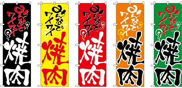
迫力・目立たせたい