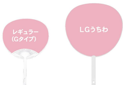
レギュラーサイズのうちわと比較

うちわの中で一番大きなタイプです。 大きな表面積を持つため、ライブ会場等で使われます。 会場での配布から物販まで、用途によって使い分け可能です。