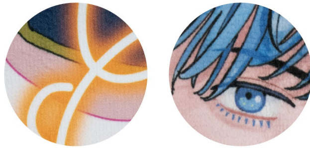
細かいデザインやグラデーションの印刷が可能です